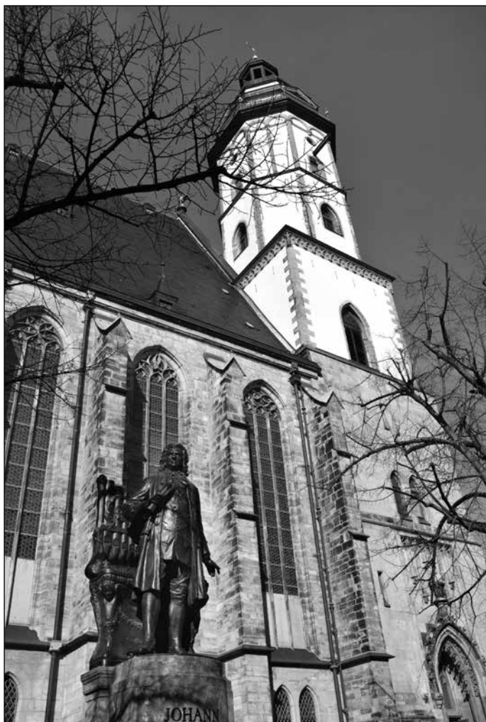
Statue av Johann Sebastian Bach foran St. Thomas kirke i Leipzig.